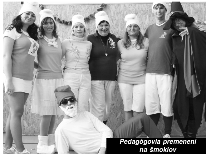
Pedagógovia premenení na šmolkov