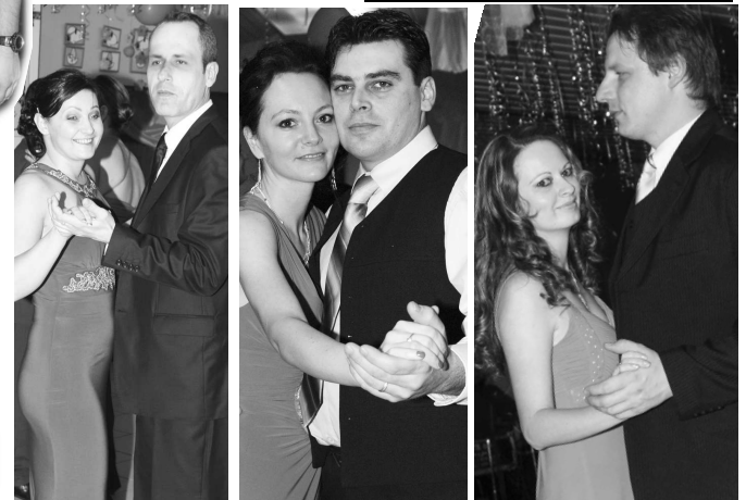
Policajtom to s ich polovičkami náramne svedčalo