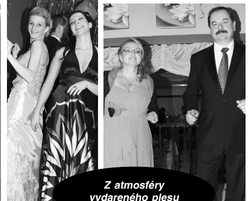
Z atmosféry vydareného plesu