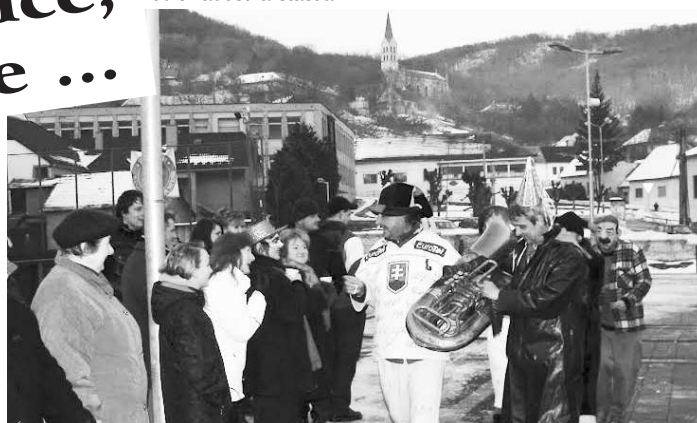
Muzikanti dychovej hudby Hradčianka putovali ulicami M. Kameňa, a pozývali domácich na poslednú rozlúčku s basou.