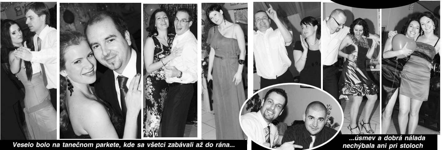
Veselo bolo na tanečnom parkete, kde sa všetci zabávali až do rána...