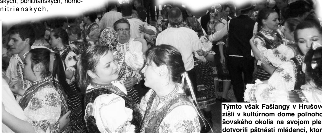
Na Hrušov sa prišlo zabaviť 300 krojovaných plesajúcich