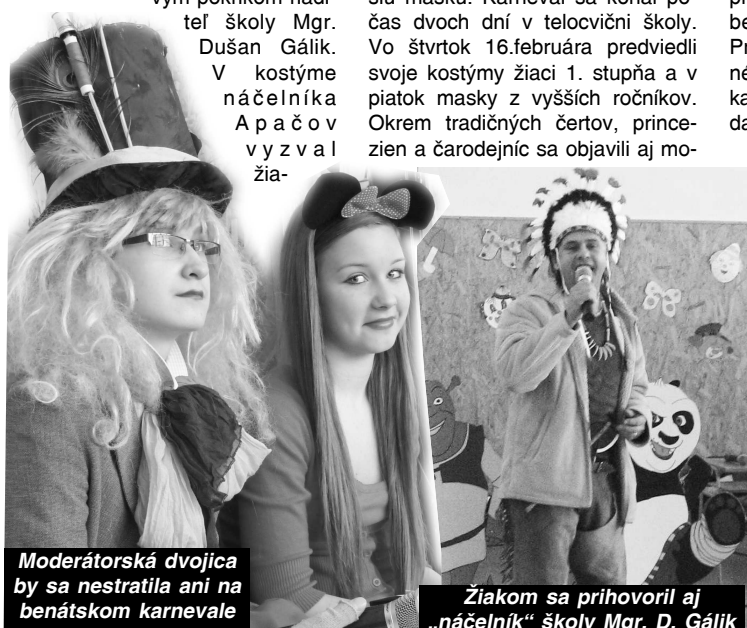
Moderátorská dvojica by sa nestratila ani na benátskom karnevale