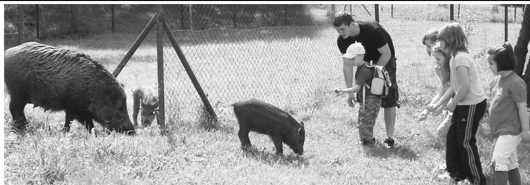
Nie všetky diviaky sú ako tie na Lešti. Vo voľnej prírode môže byť stretnutie s lesným diviakom veľmi nebezpečné

Ľudia by ich v žiadnom prípade nemali prikrmovať a približovať sa k nim. Diviaky schádzajú k ľudským obydliam práve kvôli potrave. Preto by ľudia mali zamedziť zvieratám