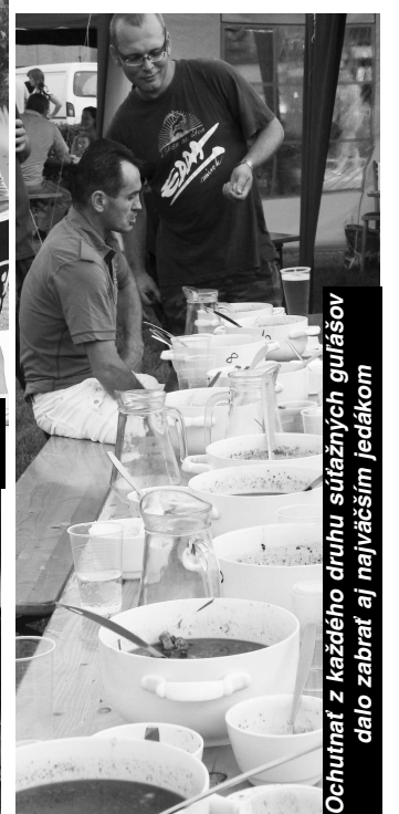
Ochutnať z každého druhu súťažných gulášov dalo zabráť aj najväčším jedákom