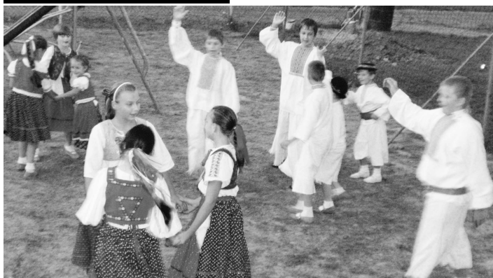
Aj mladí folkloristi z Krtíšančka osviežili podujatie.