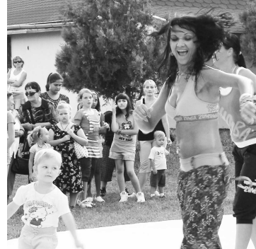
Veselo bolo pri zumbe i pri hudobnom večernom programe

Či mala porota pravdu, mohli potom posúdiť aj návštevníci, ktorí si na gulášoch pochutili a 11 kotlov sa vyprázdni-