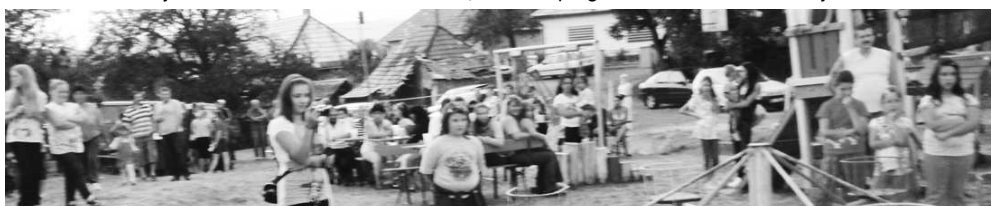
Detské ihrisko sa zmenilo na improvizované hľadisko aj javisko, na ktorom vystupoval Krtíšanček.