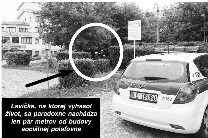
Lavička, na ktorej vyhasol život, sa paradoxne nachádza len pár metrov od budovy sociálnej poisťovne

zariadenie zatvorilo a do príchodu zimných mesiacov nemali možnosť z vlastných síl si zabezpečiť dôstojnejšie životné podmienky. Vek na starobný dôchodok ešte nemali, do zariadenia sociálnych služieb by ich bez dôchodku neprijali, boli na dávke v hmotnej núdzi. Dokonca im ukradli občianske preukazy, takže im ani tieto dávky ne-