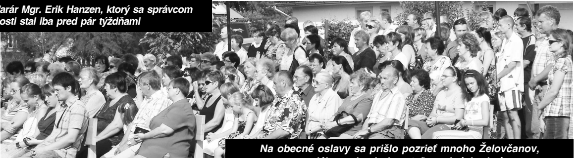
Na obecné oslavy sa prišlo pozrieť mnoho Želovčanov, rodákov, ale aj obyvateľov z iných obcí