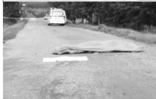
Toto auto sa stalo smrtiacim nástrojom. Pod jeho kolesami prišiel 33-ročný Vladimír o život