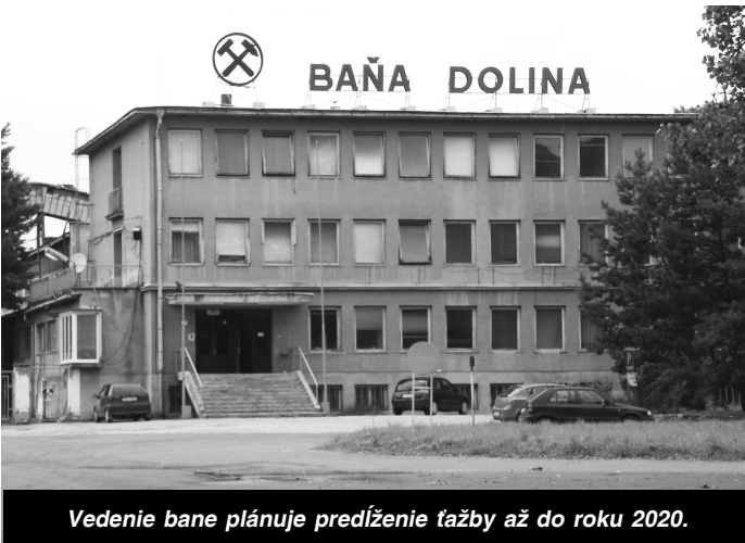
Vedenie bane plánuje predĺženie ťažby až do roku 2020.