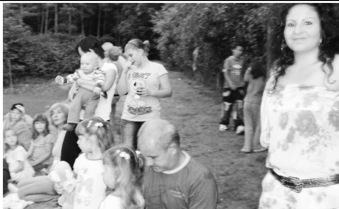
Pri vstupe na ihrisko čakalo všetkých milé prekvapenie - občerstvenie aj jedlo - ako ináč v pohostinnej Novej Vsi - všetko zadarmo.