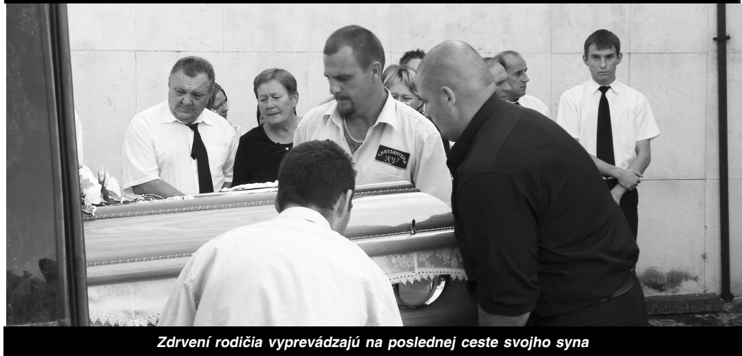
Zdrvení rodičia vpravádzajú na poslednej ceste svojho syna