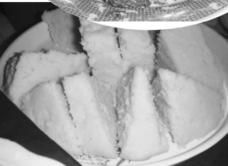
Mäso a zelenina, ktoré nevyzerali vôbec vábne a ku tomu ugali (na foto dole)

vačku, do ktorej sa vstúpilo hneď po otvorení vchodových plechových dverí, ktoré sa zamykali visacím zámkom. Byt mal ešte kuchyňu a balkón, na ktorom boli všade fľaše, bandasky a nádoby s vodou, vodou a ešte raz vodou. Domácnosť mala asi 3 kohútiky, ale nefungoval ani jeden, ako ani sprcha a splachovanie v záchode. Ale to som bola rada, že máme vôbec strechu nad hlavou. Teda doslova strechu, lebo ju bolo vidieť cez plaftón, keďže sme bývali na najvyššom poschodí.