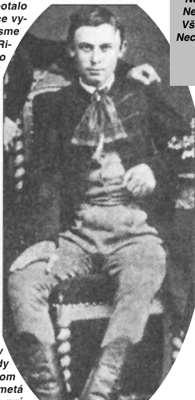
Študent Kálmán Mikszáth