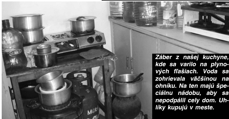
Záber z našej kuchyne, kde sa varilo na plynových fľašiach. Voda sa zohrievala väčšinou na ohnisku. Na ten majú špeciálnu nádobu, aby sa nepodpálil celý dom. Uhličky kupujú v meste.