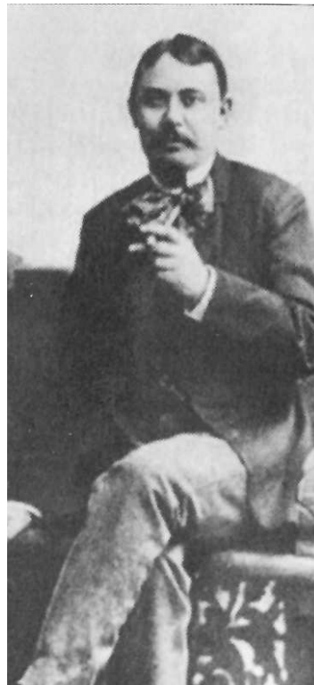
Kálmán Mikszáth - chvíľa pohody pri cigaretke...

Musíme nechať, je to pekné mesto. Včera sme prišli ulicou od Janoviec, vľavo bolo trhovisko, vpravo dobre obrobené polia. Zďaleka bolo vidieť budovu gymnázia, na dva mačacie skoky od nej sa huncútsky zatáča Rimava. Takmer pod múrmi gymnázia sa hadí akýsi potôčik, ktorý vbieha do Mlynského jarku. Povráva sa, že miestni ho volajú Tormás (Chrenový) potok, pretože hore na kopci blízko jeho prameňa v dobrej piesčitej pôde narastú štipľavé korene chrenu hrubé ako ruka. Na oboch stranách