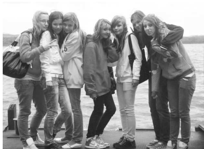
Oddych a relax v rámci školy - triedne výlety utužujú kolektívy a umožňujú spoznávať neznáme miesta. Zábery zo školského výletu na Orave