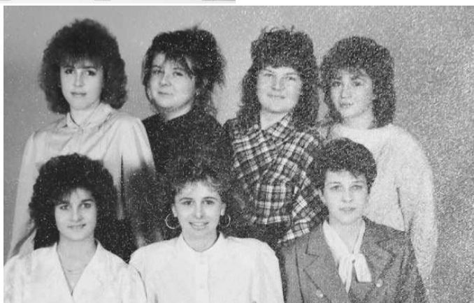
Fotografia na maturitné tablo. Spoznali ste niektorú zo žiačok?

hu práce v rámci Slovenska. Naša škola v súčasnosti ponúka, ako jediná v okrese, možnosť štúdia informatických odborov ako grafik digitálnych médií, mechanik počítačových sietí, informačné technológie a služby. Veľmi obľúbeným, hlavne u dievčat, sa stáva študijný odbor manažment regionálneho cestovného ruchu. Študenti pracujú s informáciami o cestovnom ruchu, nielen v rámci regiónu, ale aj v cestovnom ruchu ako celku, pripravujú a zabezpečujú exkurzie, výlety, od druhého ročníka pracujú vo fiktívnej cestovnej kancelárii. Ako najnovšiu novinku v ponuke odborov môže absolventom deviatych roční-