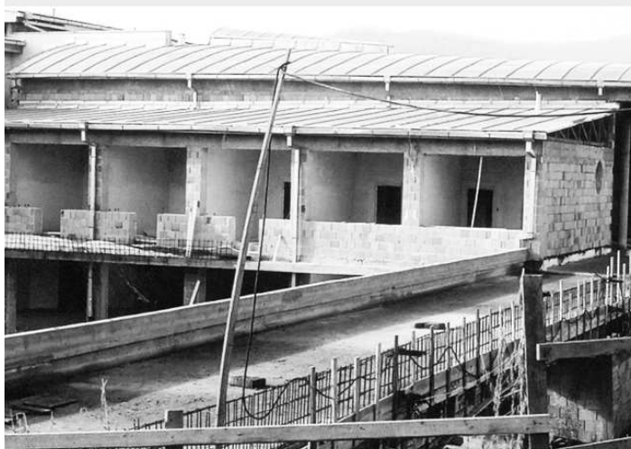
Výstavba novej budovy školy - koniec 90.-tych rokov.

kov ponúknuť odbor technické lýceum so zameraním na strojárstvo, u nás v škole tomu hovoríme technické gymnázium, lebo je to veľmi dobrá príprava žiakov prevažne na technické univerzity. Tento odbor bol žiadaný z jediného dôvodu, aby sa úplne nezabudlo v ponuke štúdií na stredné školy aj strojárstvo. Naďalej si udržujeme trend po stránke elektrotechnickej, lebo je záujem o odbor elektrotechnika, v ktorom žiaci po maturitnej skúške môžu získať osvedčenie (doklad, vysvedčenie, certifikát...) na elektrotechnickú spôsobilosť. Ako jediná škola v okrese ponúkame aj žiakom z iných škôl obohacovať svoje vedomosti z výpočtovej techniky navštevovaním CISCO akadémie, ktorá sa zameriava na sieťové technológie.