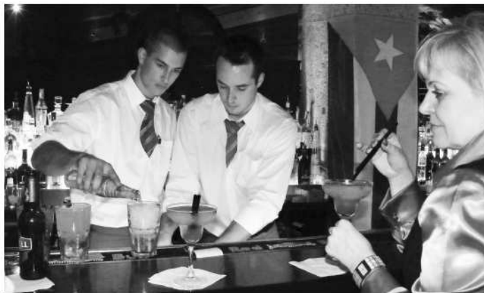
Na šikovných a fundovaných barmanov bola radosť pozeráť

Ten sme si mohli dať pri bare, kde na ochutnávku ponúkali štyri druhy rumu. Dva druhy kubánskeho rumu 5 a 12 ročného z druhej najznámejšej destilérie na Kube Mulata (Mulata je najlepšie rum na Kube. Je jedným z mála uznávaných kubánskych rumov ako doma, tak aj vo svete. Je stáčaný priamo na Kube a je to teda pravý kubánsky originál. (Pokračovanie na str.22)