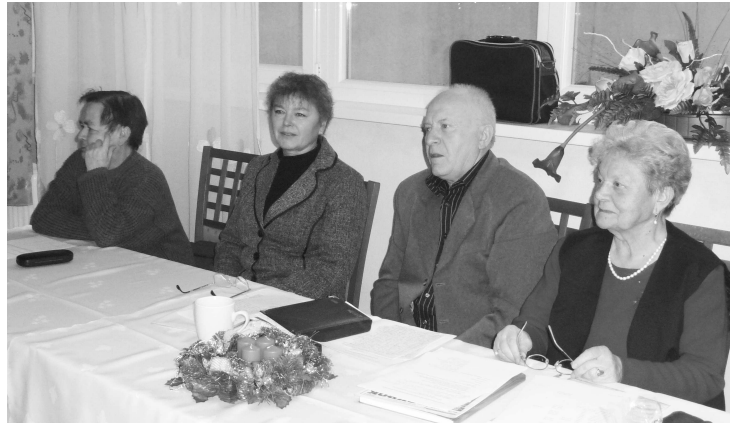
Sviatočnú atmosféru bolo cítiť aj za predsedníckym stolom

V úvode obohatili rokovanie žiaci Základnej umeleckej školy vo V. Krťiši, ktorí pod vedením svojich pedagógov prišli pozdraviť a potešili prítomných hodnotným kultúrnym programom. Po vystúpení navštívili členov počas rokovania Mikuláš,