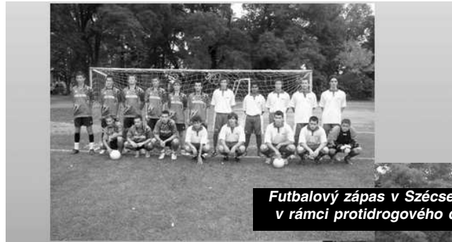
Futbalový zápas v Szécsenyi v rámci protidrogového dňa

Niekoľko rokov spolupracujeme a udržiavame priateľské vzťahy so školou v maďarskom Szécseny. V rozbehnutej spolupráci sme načrtli priority nášho vzťahu založeného na prehľbovaní priateľských vzťahov cez športové podujatia (hlavne futbalové priateľské zápasy, v ktorých máme zatiaľ jednoznačne navrch ☺). Organizujeme výmenu vyučujúcich cudzích jazykov s cieľom nazbierať skúsenosti a vymeniť si