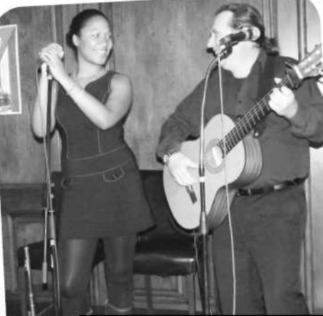
Kubánsku atmosféru dotvárala kapela, hrajúca, ako inak, kubánske šlágre

Po dobrom jedle a pri dobrom nápoji nemôže na kubánskom