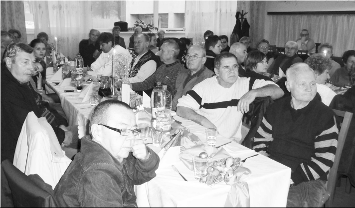
Členovia Slovenského zväzu zdravotne postihnutých majú za sebou pestrý rok plný aktivít

Slovenský zväz zdravotne postihnutých je dobrovoľné občianske združenie zdravotne postihnutých občanov a priateľov. Zameriava sa na presadzovanie pomoci v oblasti sociálnych služieb, zdravotníctva, spoločenskej i pracovnej integrácii a kultúrno - spoločenského života svojich členov.