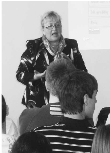
Beseda s europoslankyňou Zitou Pleštinskou