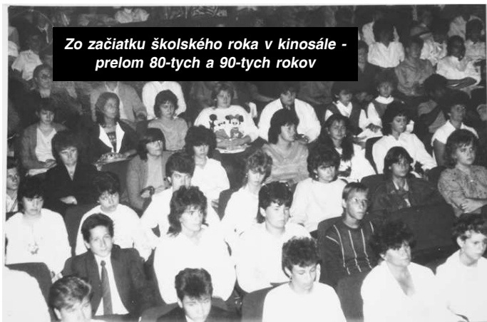
Zo začiatku školského roka v kinosále - prelom 80-tych a 90-tych rokov