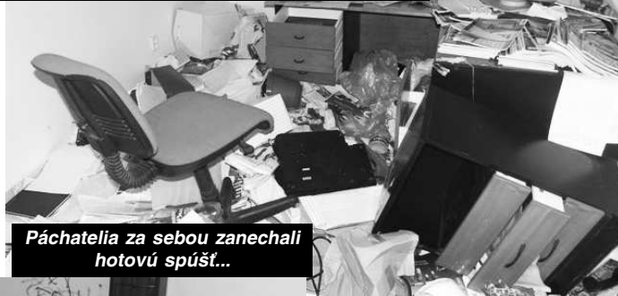
Páchatelia za sebou zanechali hotovú spúšť...

čení objektu. Spoločným konaním poškodili vchodové dvere do drevenej budovy skladu, kde porozhadzovali zariadenie všetkých miestností nachádzajúcich sa v sklade, pričom zničili materiál nachádzajúci sa v sklade, následne prešli k dverám vedľajšej haly, kde vylome-