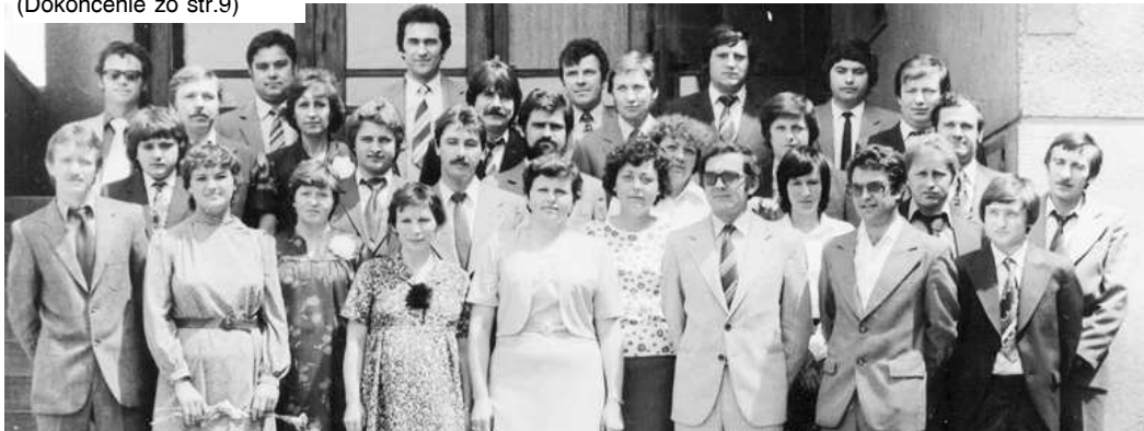
Pedagogickí zamestnanci školy v osemdesiatych rokoch minulého storočia, kedy sa vyučovalo v budove terajšieho gymnázia