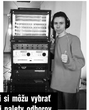
Študenti si môžu vybrať z pestrej palety odborov