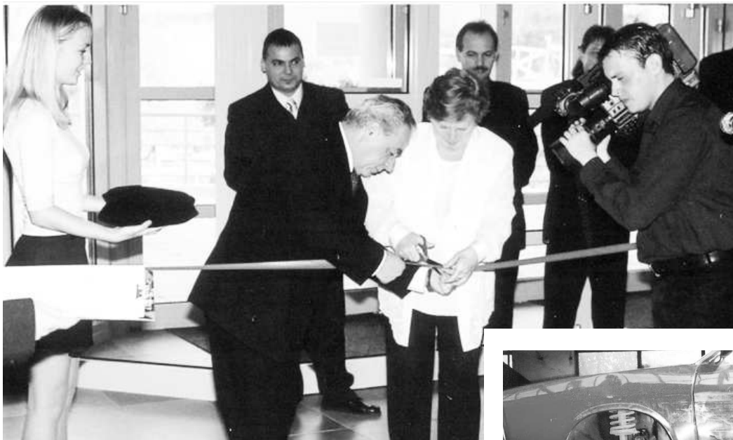
Slávnostné otvorenie novej budovy školy v roku 2002

Vo voľnočasových aktivitách sa zameriavame na ďalšie prehľbovanie vedomostí a zručností našich žiakov cez bohatý výber krúžkov od zamerania na všeobecno-vzdelávacie predmety až po odborné, kde žiaci rozvíjajú svoje kompetencie získané na vyučovacích hodinách.