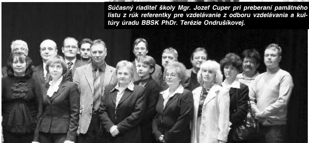
Terajší a bývalí zamestnanci a priatelia školy. Fotografia zo slávnostnej akadémie pri príležitosti 30. výročia vzniku školy