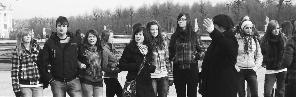
Návšteva metropoly Rakúska bola pre našich gymnazistov nezabudnutelným zážitkom