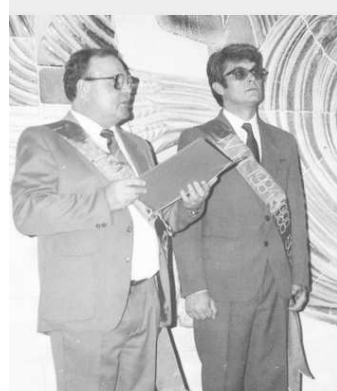
Zo stužkovej slávnosti v roku 1988