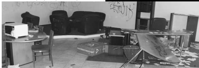
...polícia však zlodejom klepla po prstoch a trinástich zlodejov čaká spravodlivý trest