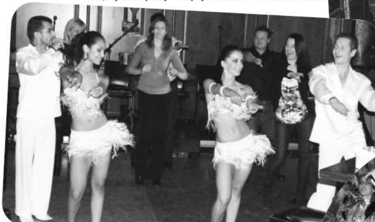
Kuba je synonymom temperamentu a počas večera sme mali možnosť zapojiť sa do krátkej školy salsy

po jej konečnú podobu trvá pravidla 2-3 roky. Záleží to od dĺžky sušenia tabakového listu, od doby fermentácie a až potom ide na spracovanie. Teraz napr. začala Cohiba vyrábať nový druh Cohi-