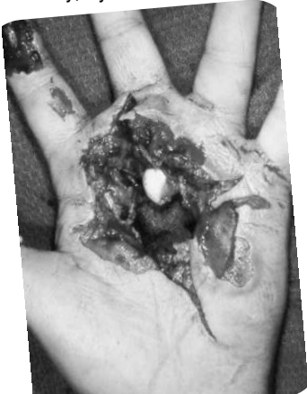
Aj takto môže dopadnúť nesprávna manipulácia so zábavnou pyrotechnikou

používať len osoba, ktorá má viac ako 18 rokov. Okrem dodržiavania zásad správneho používania zábavnej pyrotechniky, by sme ne-