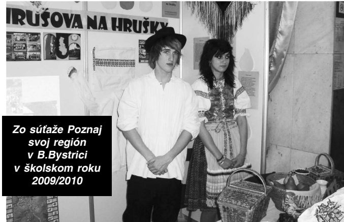
Zo súťaže Poznaj svoj región v B.Bystrici v školskom roku 2009/2010

poznatky s inými školami a prípadne porovnať pripravenosť našich žiakov. Ako jediní ponúkame vyučovanie talianskeho jazyka a našu ponuku chceme rozšíriť o ruský jazyk.