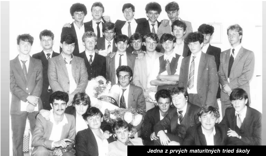
Jedna z prvých maturitných tried školy

Od tohto obdobia sa mení aj štruktúra a zameranie ponúkaných odborov. Zmenu, prevažne študijných odborov, si vyžiadali dlhotrvajúci nezáujem absolventov základných škôl o strojársku a elektro odbory. Po niekoľkých rokoch škola ponúka atraktívne, ale hlavne zaujímavé odbory, ktoré zvyšujú dobrú uplatniteľnosť absolventov na tr-