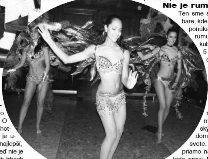
Okrem rumu nás rozpálili aj tanečnice zo Sabrosury...