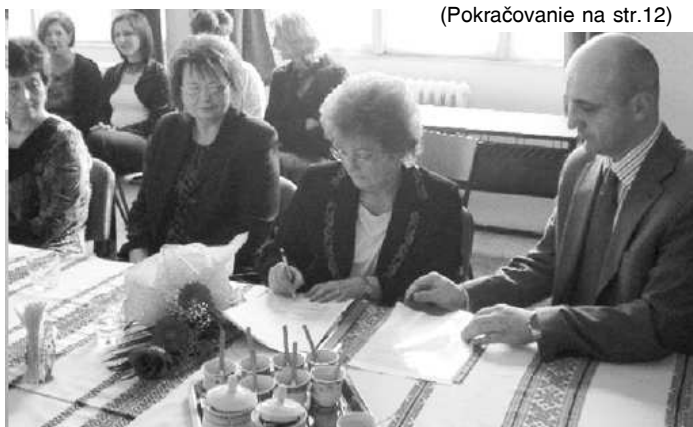
Škola si vytvára aj kontakty so zahraničím. Podpísanie dohody o spolupráci s Gymnázium v Szécsenyi