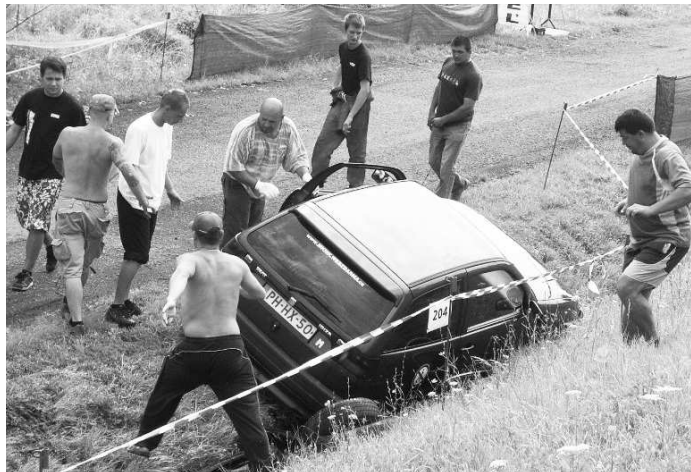
... keďže je o nej známe aj to, že na nej niet počas pretekov núdze o dramatické momenty