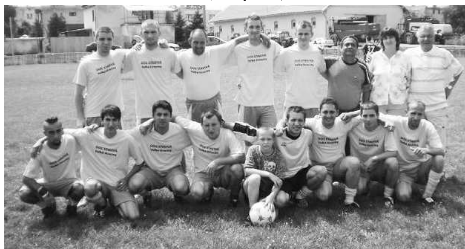
Víťazný tím mal radosť z prvenstva, z vydareného podujatia, diváckej podpory i z predaných tombolových lístkov, vďaka ktorým si mohol kúpiť kosačku