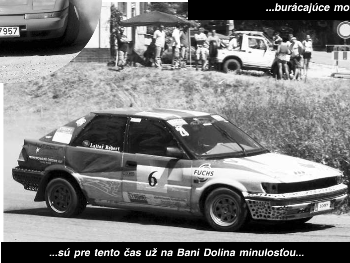
...sú pre tento čas už na Bani Dolina minulosťou...