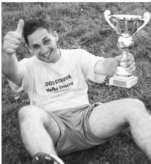
Úprimná radosť hráčov z úspechu bola evidentná