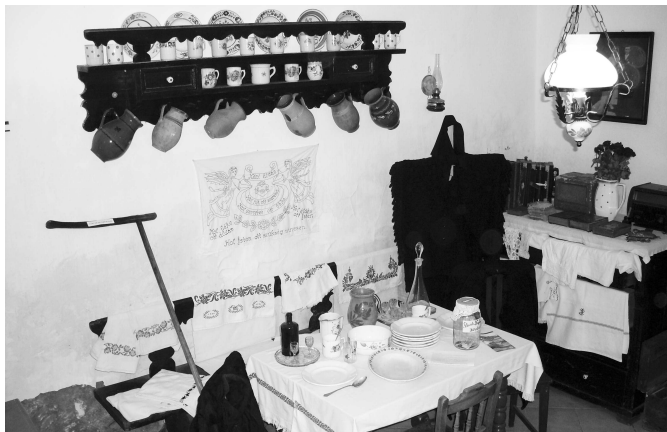
Slovenčina na každom kroku, taký je Šámsonház.