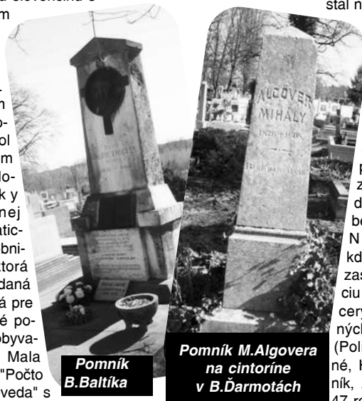
Pomník B. Baltíka