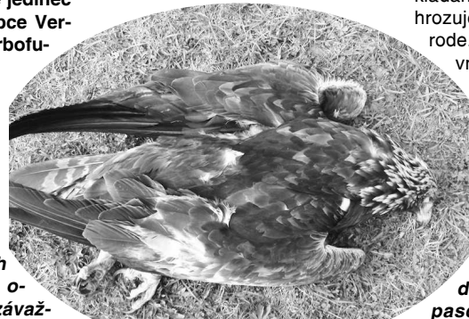
Obrázok, ktorý stisne srdce nielen ochranárovi

som mäsa v zobáku. Bolestivá smrť nastáva v dôsledku udusením spôsobeného ochrnutím dýchacieho svalstva. Karbofurán je