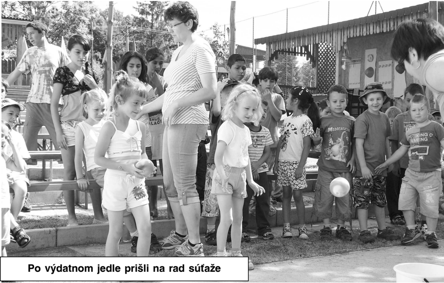
Po výdatnom jedle prišli na rad súťaže

Posledné júnové dni naplnené troškou letného tepla i stresom z blížiaceho sa konca školského roka, môžu byť aj plné radosti, súťaživosti a zábavy.