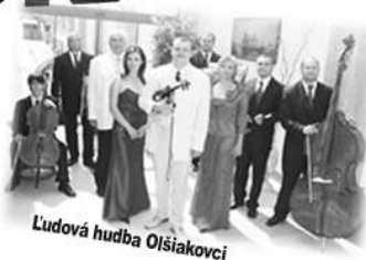
Ludová hudba Olšiakovci