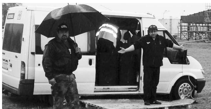
Ako sa nakoniec ukázalo, voda na trati urobila preteky ešte atraktívnejšími

technické vybavenie a zvyšujú tak úroveň a prehľadnosť dosiahnutých výsledkov pretekov. Zaujímavým spštením bola minivýstava vozidiel OPEL predajcu z Lučenca a k dobrej nálade výrazne prispel stánok s rýchlym občerstvením, kde príjemná obsluha s úsmevom podávala občerstvenie, rôzne teplé