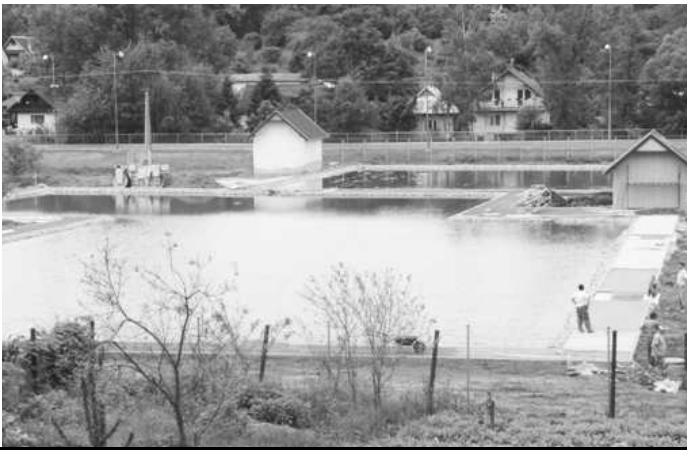
Prostredníctvom internetu prišlo na www stránku mesta 93 návrhov pomenovaní pre nové kúpalisko vo V.Krtíši