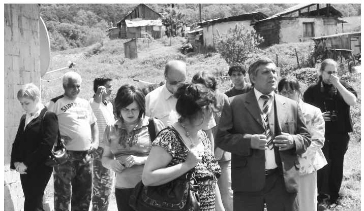
Oveľa viac ako s hrušovskou bol splnomocnenec spokojný s rómskymi osadami v Čelovciach i Kosihovciach.

Na stretnutie s predstaviteľmi obcí s rómskymi komunitami z Hrušova, Čeloviec, Kosihoviec i terénnymi sociálnymi pracovníkmi a asistentmi z týchto obcí, predstaviteľmi OO PZ vo Vinici, ktorí realizujú projekt "rómski špe-