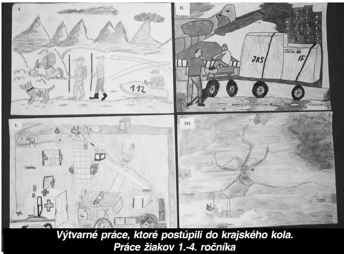
Výtvarné práce, ktoré postúpili do krajského kola. Práce žiakov 1.-4. ročníka

Spracoval: odborný radca odboru civilnej ochrany a krízového riadenia Obvodný úrad Veľký Krtíš, Mgr. JÁN VOZÁR