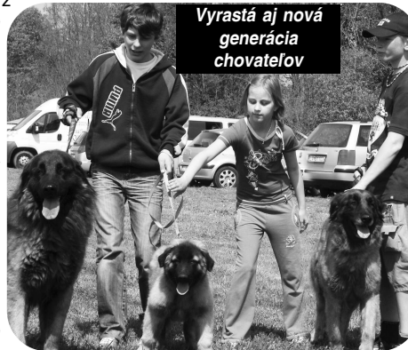
Vyrastá aj nová generácia chovateľov

zahrat, keďže vidím, že rodičia sem s deťmi prichádzajú doslova ako na výlet - na akciu, kde spoločne zažijú niečo nezvyčajné a nezabudnuteľné. Aj keď som mal spočiatku neprajníkov, stále si myslím, že takéto podujatie v našej obci ľudí zblázuje. Verím, že budeme v tradícii usporadúvania tejto výstavy pokračovať aj v budúcnosti."