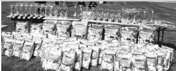
Chovatelia molossov si "brúsili zuby" na čo najcennejšie poháre, ich štvornohým priateľom zase tiekli slinky na značkové psie krmivo

združuje chovateľov, majiteľov a milovníkov molosských plemien, pričom členmi klubu sú i zahraniční chovatelia. Na území Slovenska je jediným klubom, ktorý zastrešuje všetky molosské plemeno. Napriek tomu, že chov molossov začal na našom území až koncom 70-tych rokov, pričom naši chovatelia v niektorých plemien (napr. Mastino Napoletano) boli prvými zakladateľmi chovov v rámci bývalých socialistických štátov, je pravdepodobné, že predkovia dnešných molossov - veľké psy Keltov a Rimanov - boli na území západnej časti Slovenska ešte pred príchodom Slovanov.