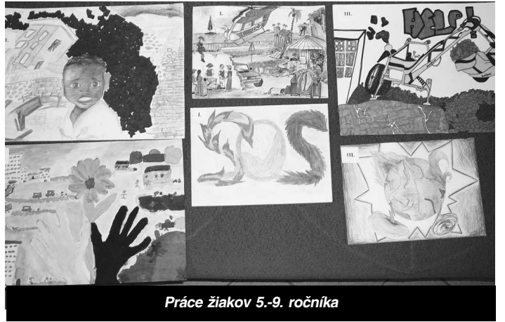
Práce žiakov 5.-9. ročníka