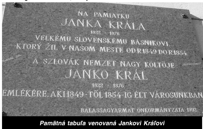
Pamättná tabuľa venovaná Jankovi Kráľovi