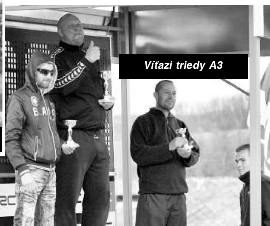
Víťazi triedy A3