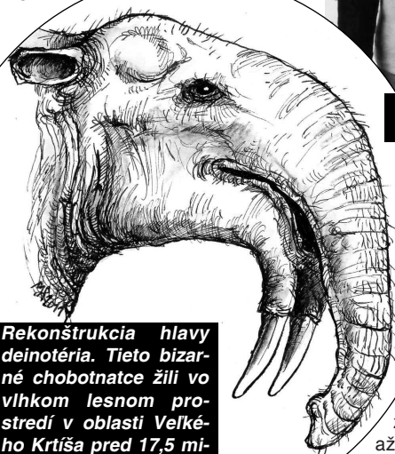
Rekonštrukcia hlavy deinotéria. Tieto bizarné chobotnatce žili vo vlhkom lesnom prostredí v oblasti Veľkého Krtíša pred 17,5 miliónov rokov. Kresba Matúš Hyžný.

Deinotériá sa stavbou a mohutnosťou tela podobali dnešným slonom, s ktorými však boli len veľmi vzdialení príbuzní. V porovnaní so súčasnými slonmi mali kratší chobot a zuby s