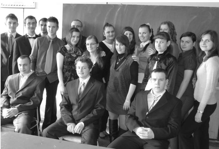
Na gymnáziu maturovali tri triedy, na foto dve z nich - oktáva (dole) a 4.B.