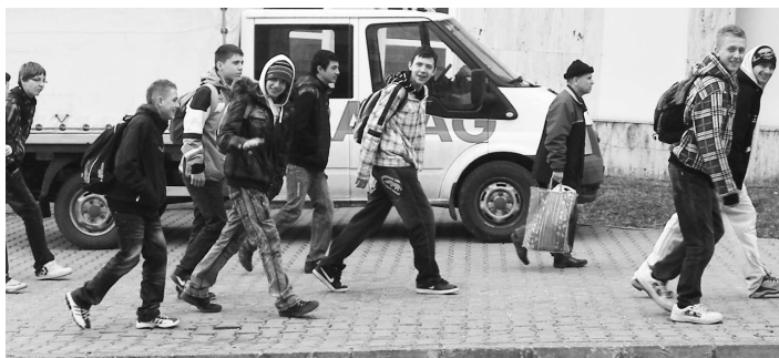
Rekonštrukcia námestia bude patriť k pamätným chvíľam aj pre týchto žiakov, ktorí boli doteraz zvyknutí na starú tvár mesta