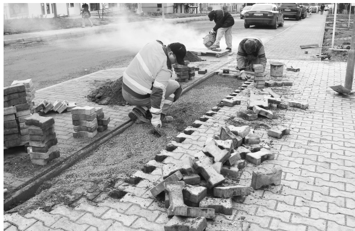
Na zrekonštruované centrum mesta sa môžu obyvatelia, ale aj návštevníci V. Krtíša tešiť v letných mesiacoch tohto roka, kedy by sa mala revitalizácia skončiť.