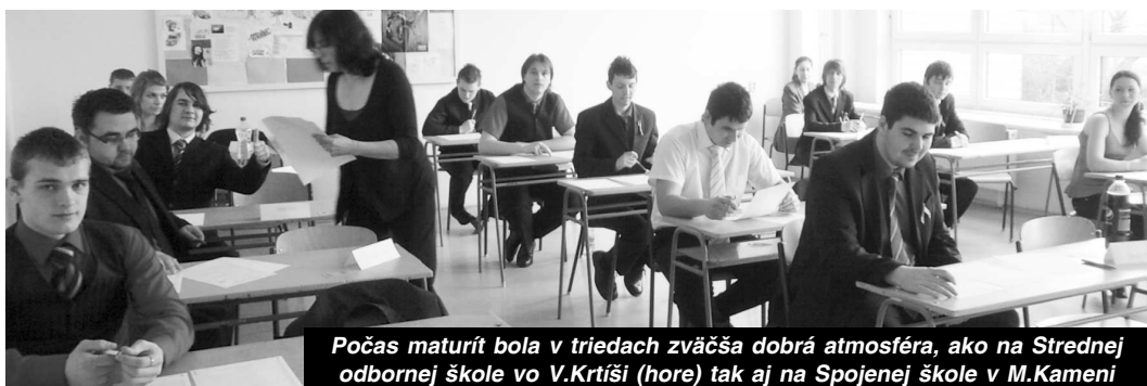
Počas maturít bola v triedach zväčša dobrá atmosféra, ako na Strednej odbornej škole vo V. Krtíši (hore) tak aj na Spojenej škole v M. Kameni

Na Spojenej škole v M. Kameni, ktorá sa skladá z dvoch organizač-