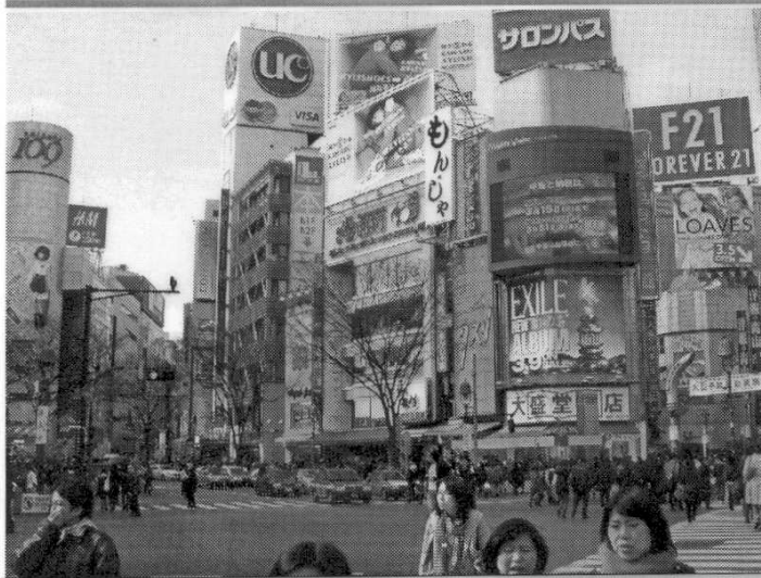
Pulzujúci život v meste. Po zemetrasení zostal ochromený.

ne zaznamenaných asi 1500 otrasov, začnú hneď v prípade očakávania väčšieho zemetrasenia zvony zvonit a ľudia sa začínajú zhrmažďovať a voľnom priestranstve. Urobili sme tak aj my. Kto mohol, ten si sadol, a takto sme čakali asi polhodinku alebo hodinku, kým sa zemetrasenie utišilo, ukludnilo. Miesta, kde mala lucerna také veľké výkvy a popadali skaly hneď ohradili, aby to nikoho nezranilo. Potom sme išli do mesta a tam opäť o približne hodinu až hodinu a pol opäť začali otrasy. Bol to veľmi nepríjemný pocit. Videli sme aj tu zrútenú kamennú lucernu, ktorá síce nikoho nezranila, ale aj tak to bolo veľmi nepríjemné, pretože v Japonsku majú všetko vedené po stĺpoch. Neskôr sme sa išli pozrieť k moru, ale tam už vyzývali ľudí, aby opustili pobrežie, ktoré už bolo zaistené pred hroziacou cunami. Tá údajne prišla až o hodinu a pol na miesto, kde sme boli my, ale bola to len malá vlna, asi v metrovej výške."