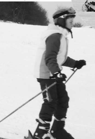
Rodičia by mali viesť deti k športu a počas priaznivej zimy využiť možnosť skvele si zalyžovať v našom okrese