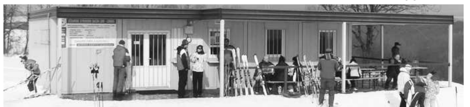
Pohodička medzi a po lyžovačke - vhod príde občerstvenie v bufete