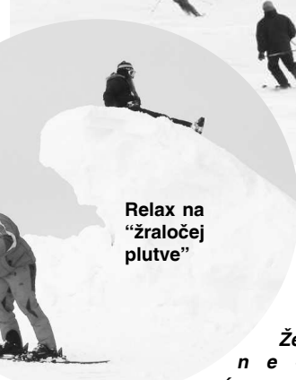
Relax na "žraločej plutve"

nebolo vidieť. Nakoniec to vyzera, že asi študovali! Kiežby aspoň to!