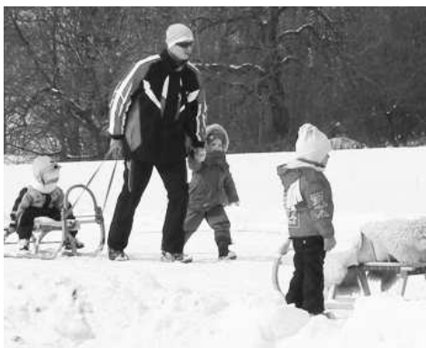
Na svoje si na Lomníku prídu aj tí najmenší