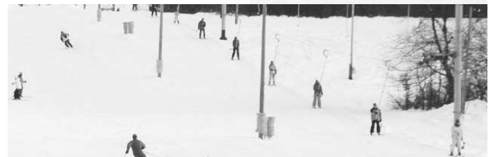
Relax na "žraločej plutve"