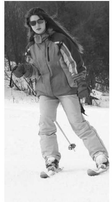
Zimné krásy na Lomníku

naši športovci akosi nevládzu tak vysoko dosiahnuť. A tí, ktorí sa aspoň približujú, za chvíľu skončia kariéru, veď čas je neúprosný ku všetkým. Kto nahradí Pálffyho, Šatana, Hurajta a ďalších? Alebo po vzore Kuzminovej kúpime napríklad skokana na lyžiach trebárs z Burundi?? A naše deti nech sa váľajú doma na gauči pred "telkou", alebo pred PC a po večeroch kdesi na podivných zábavách a "žúrkach", na ktorých je cieľom čo najrýchlejšie sa dostať z rozumu. Veď to robí aj susedov fagan. Vážení rodičia, toto je ale téma pre nás! Je na nás, rodičoch, viesť deti k čomusi zmysluplnému od malička a nie nechať ich vychovávať "tupými" filmami, či počítačovými hrami pod akoukoľvek zámienkou. Ak vaše dieťa nebude vedené napr. k športu, nebude ani ono v dospelosti viesť svojich potomkov k športu! A kolotoč je uzavretý.